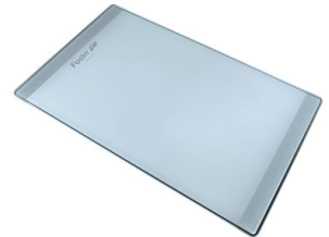
Planche de découpe en verre 8631 300